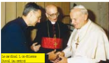
Le cardinal L. on-Etienne Duval (au centre)

Mgr Duval, en plein débordement de la violence, voulait empêcher le désastre en refusant la logique disjonctive de l'affronte-