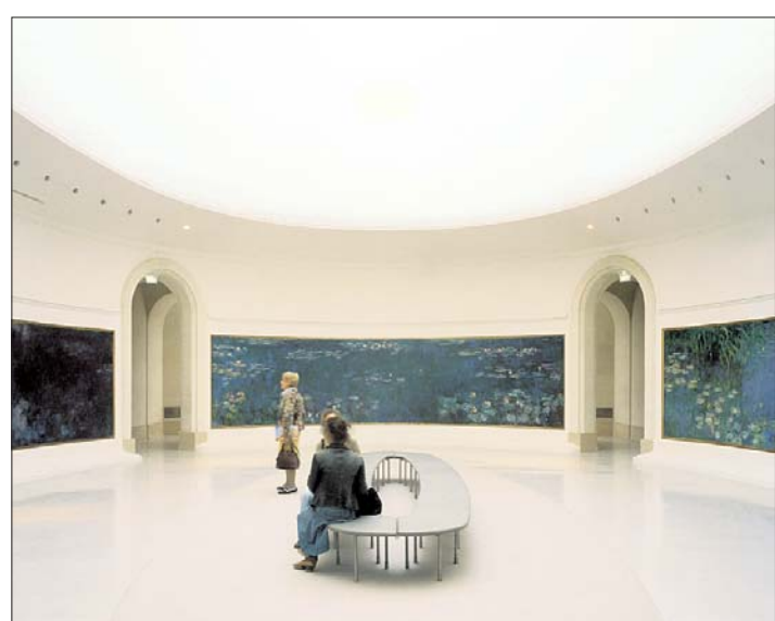
Une des deux salles des « Nymphéas », de Monet, dans l'Orangerie rénovée.