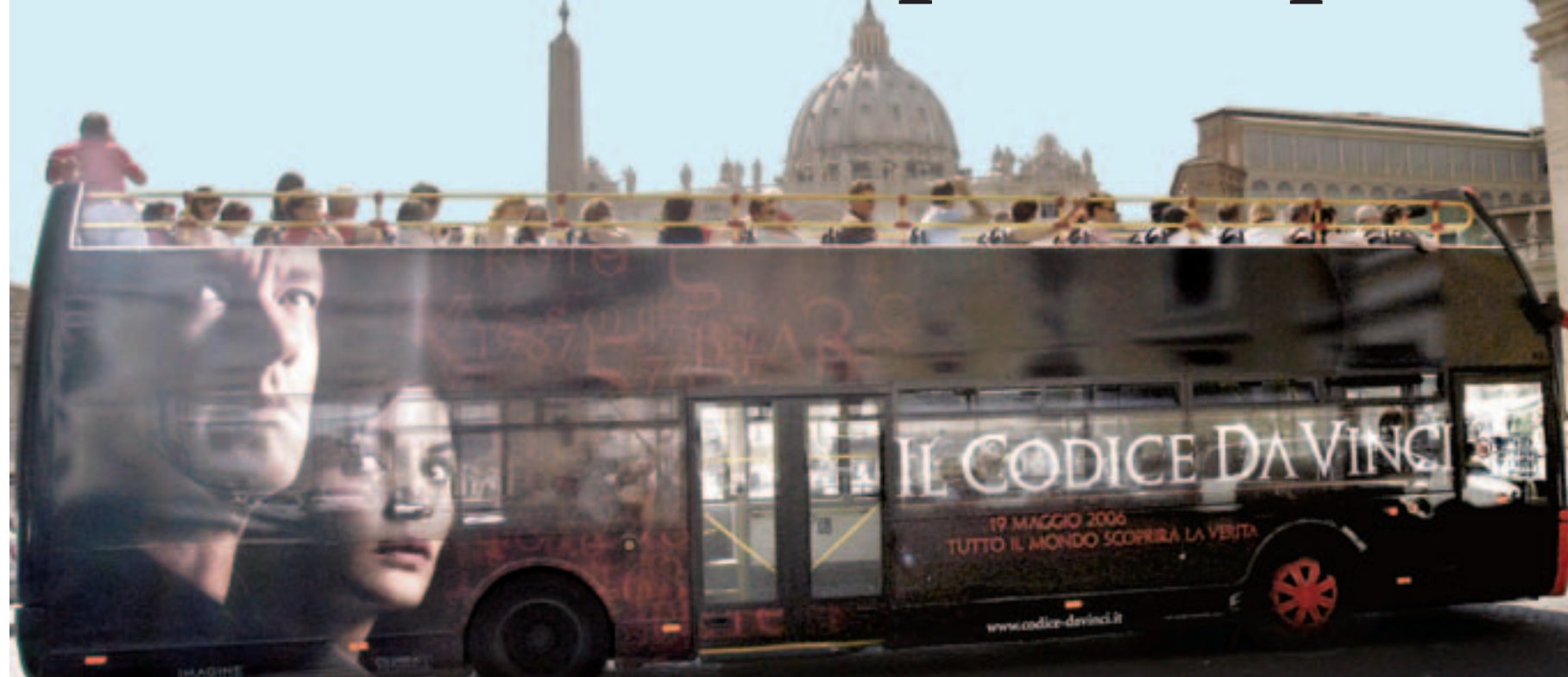
Les « Da Vinci Tours » se multiplient en Europe. Ils proposent aux touristes de visiter les lieux évoqués dans le livre de Dan Brown. Ici, devant la basilique Saint-Pierre de Rome.